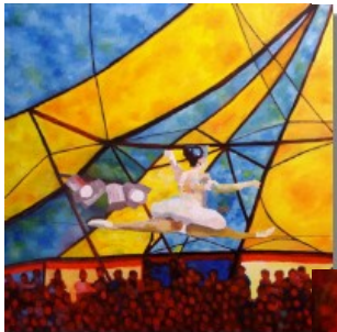
Seiltänzerin 100 x 100 cm Seiltanz führt an die Grenzen der eigenen Balance. Die Welt des Zirkus ist eine eigene, uns fremde Welt.