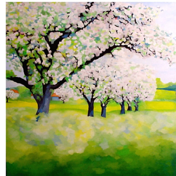
Streuobstwiese 100 x 100 cm

Die Art Galerie Unikat in Gelsenkirchen ist eine junge Galerie. Ihr Bestreben ist es, die Kunst als Verständigungsmittel aller Menschen zu fördern. Besucher sollen die Zeit haben, Kunstobjekte auf sich wirken zu lassen. Hier ihre eigene Interpretation zur Kunst und zum Objekt finden. Für sich allein oder im Gespräch mit der Galeristin. Ohne Interpretationsmachtspiel und ohne erklärende Literatur. Jeder soll die Möglichkeit bekommen, sich in Balance zur Kunst und Kultur zu empfinden. Die Art Galerie bietet jedem einen Platz zum Rückzug. Nach einem stressigen Tag zur Entspannung oder als gewollte Zeit der Muße. Bei einem gemütlichen Kaffee oder Tee. Kunstinteressierte sind werktags in der Zeit von 10 bis 18 Uhr immer herzlich willkommen.