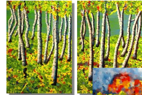
Junge Birken am Fluss 2 x 100 x 70 cm

Man sollte alle Tage wenigstens ein kleines Lied hören, ein gutes Gedicht lesen, ein treffliches Gemälde sehen und, wenn es möglich zu machen wäre, ein vernünftiges Wort sprechen.