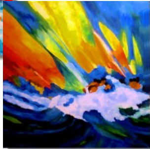
Segelregatta 100 x 100 cm Boote segeln an der Grenze zweier Medien, nämlich Luft und Wasser. Ein Kampf mit den Urganwalten der Natur.