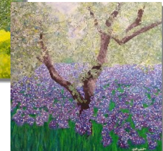
Olivbaum im Lilienfeld 100 x 100 cm Es ist Silber, das mal ins Blaue, mal ins Grüne spielt. Bronzefarben und beinahe weiß auf gelb, rosa, violetterem und orangenem Boden.

Birken sind die Pioniere der Landschaften und sehr anspruchslos. Man findet sie häufig auf Industriebrachen.