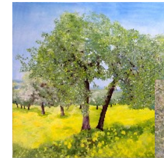
Olivenhain im Frühling 100 x 100 cm Olivenhäuser prägen das mediterrane Landschaftsbild.