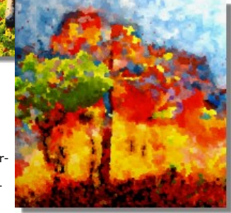
Waldbrand 100 x 100 cm Ein Waldbrand ist auch ein natürliches Ereignis und in gewisser Weise auch ein Erneuerungsprozess