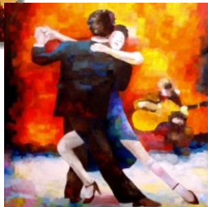
Tango Argentino Paar mit Spieler 100 x 100 cm Balance lässt sich auch in der bewussten Bewegung erfahren. Kommt dann noch Musik und Kommunikation dazu, landet man unweigerlich beim Tango Argentino.