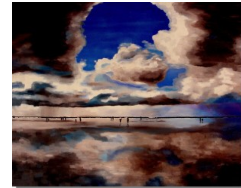
Nordsee 120 x 150 cm Der Strand hat seit jeher etwas Magisches für den Menschen. Es ist, als wenn der ewig Wind die Gedanken im Kopf reinigt.